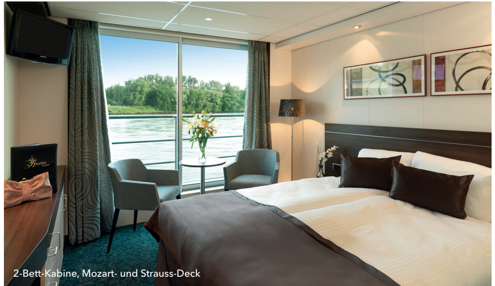
2-Bett-Kabine, Mozart- und Strauss-Deck