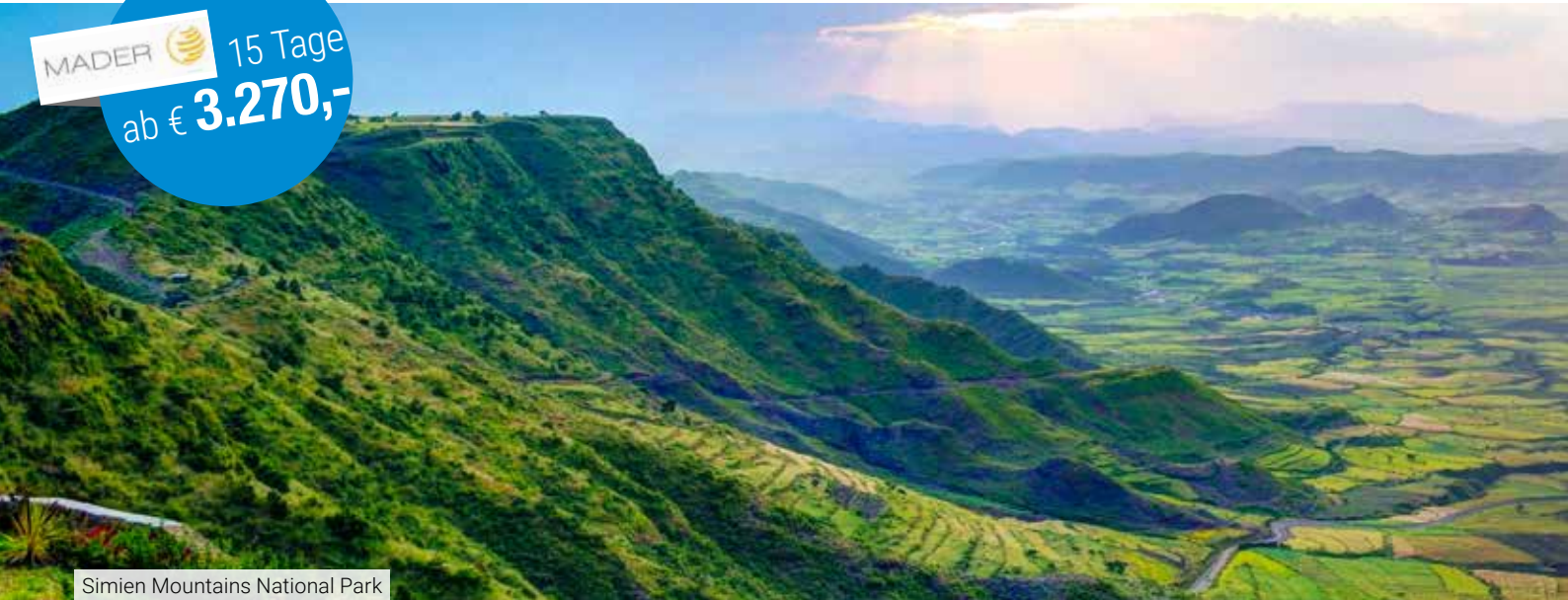
Simien Mountains National Park

B esuchen Sie das Land am Ursprung des Blauen Nils. Sie erleben sechs Welterbe Stätten der UNESCO, wie Gondar und Lalibela und sehen die UNESCO-Regionen Simien Mountains und den Tana- und Chamosee. Die Gastfreundschaft der Menschen und die Landschaften werden Sie begeistern. Eine unvergessliche Reise in den Norden und Süden dieses einmaligen Landes. Ein Höhepunkt ist der Besuch des Timkat-Festes. Diese eindrucksvollen Zeremonien erinnern an die Taufe Christi. Sie erleben fröhliche Menschen, die tanzend und singend dieses einmalige Fest feiern.